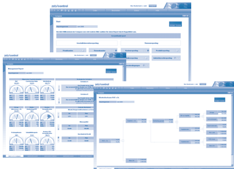
Abb. 2: Ausgewählte Management-Berichte des compass

Auf dieser technischen Basis wurde als bislang im Wettbewerbsvergleich einzigartiges Modul der zeb//control compass als Weiterentwicklung bestehender Reporting-Cockpits umgesetzt. Im Unterschied zu den am Markt befindlichen Lösungen bietet dieses Modul neben einem managementorientierten Reporting auch die Möglichkeit, Ursachen für Zielabweichungen automatisiert zu ermitteln und Empfehlungen für Maßnahmen zu generieren. Zusätzlich können über Werttreiberbäume die wesentlichen Zusammenhänge zwischen einzelnen Erfolgsgrößen (z. B. dem Economic Value Added [EVA] und der Risikotragfähigkeit einer Bank) sowie relevanten Werttreibern (z. B. Neugeschäftsvolumen im Privatkundenbereich) transparent dargestellt und Auswirkungen von Maßnahmen simuliert werden (vgl. Abb. 2).